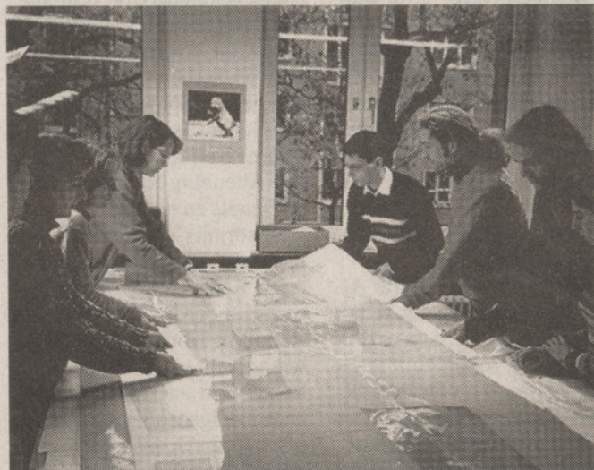
Studenten der Fachhochschule Köln sind dabei, die Transparentrolle in minuziöser Feinarbeit zu restaurieren.